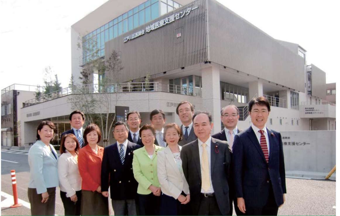
完成した江戸川区医師会地域医療支援センター前で、区議会公明党13名